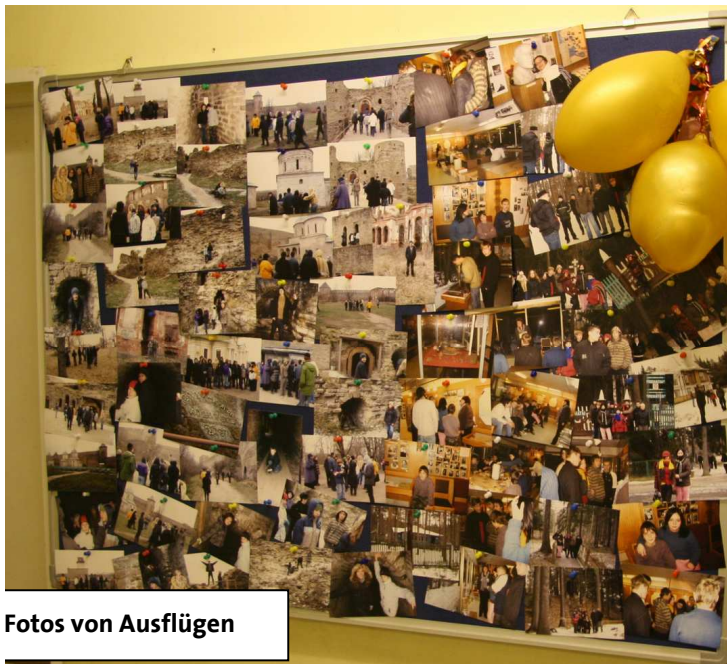
Fotos von Ausflügen