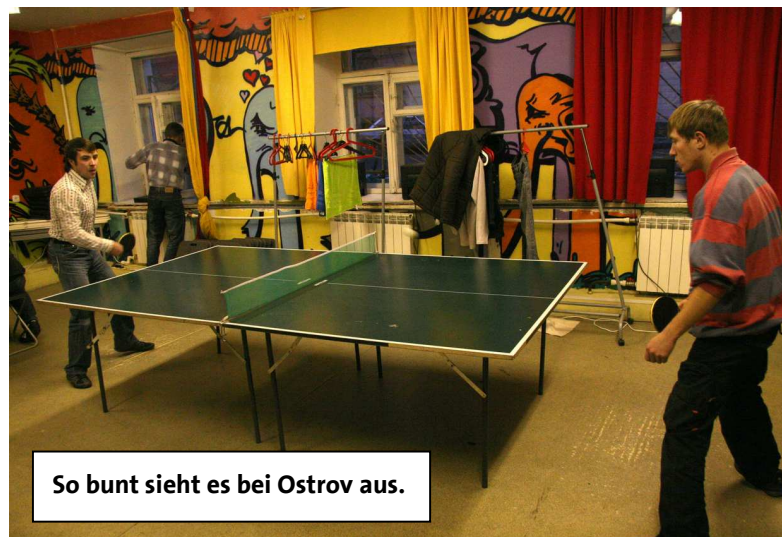
So bunt sieht es bei Ostrov aus.

Die Kindernothilfe unterstützt das Projekt seit 1998. Die Wände sind knallbunt bemalt. An einer Wand stehen Schließfächer, in denen die Kinder ihre Habseligkeiten einschließen können, damit sie ihnen auf der Straße nicht geklaut werden. Es gibt ein Bad mit Dusche und Toilette, eine Tischtennisplatte und dicke Matten zum Turnen. An den Wänden hängen unzählige Fotos von Ausflügen, die die Mitarbeiter mit den Mädchen und Jungen gemacht haben.